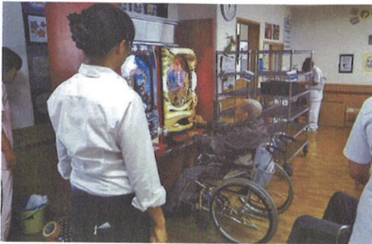
介護施設にパチンコ台を無償で貸し出し [写真①②]