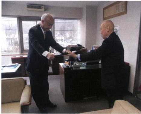
法務大臣より感謝状を受領【写真①】